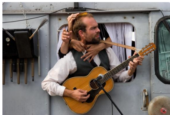
L'Orchestre d'Hommes-Orchestres