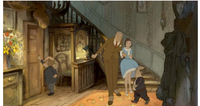
L'illusionniste de Sylvain Chomet