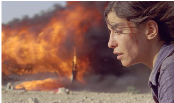
Incendies de Denis Villeneuve

Suivront le 28 juillet, Le discours du roi , oscarisé à plusieurs reprises, et le 7 août, Incendies , du désormais célèbre Denis Villeneuve.