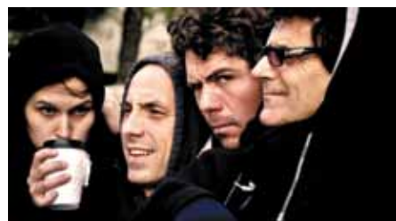
Wop Pow Wow