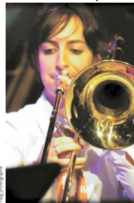
Le Chœur Éolien