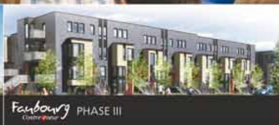
Faubourg PHASE III