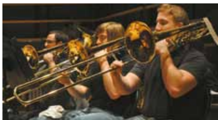
L'Orchestre de Jeux Vidéo