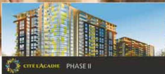
CITÉLACADIE PHASE II