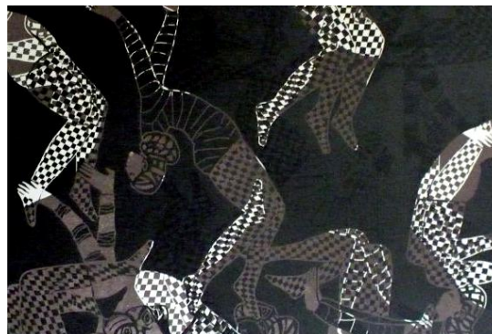
ACRO 1, BOIS GRAVÉ (57X76CM) / CLAIRE LEMAY

L'exposition compte les œuvres de vingt artistes québécois et de six membres de Xylon-France. La xylographie est un procédé de taille d'épargne. Elle consiste à creuser l'espace négatif et à préserver la forme à imprimer. Les images proposées réfèrent à la danse, à la musique, à la virtuosité de l'acrobate, le projet s'articulant autour de la rencontre de deux traditions : les arts du cirque et la gravure en relief.