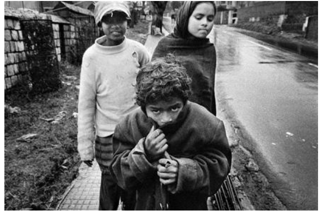
LES RÉFUGIÉS DU CLIMAT